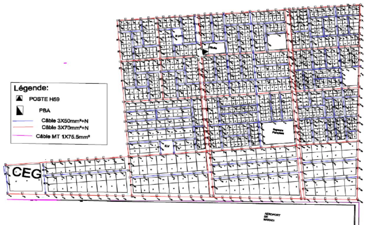
Map 2 : Exemple de cartographie dans une localité avec plan Cadastral (ci-dessus Maradi)