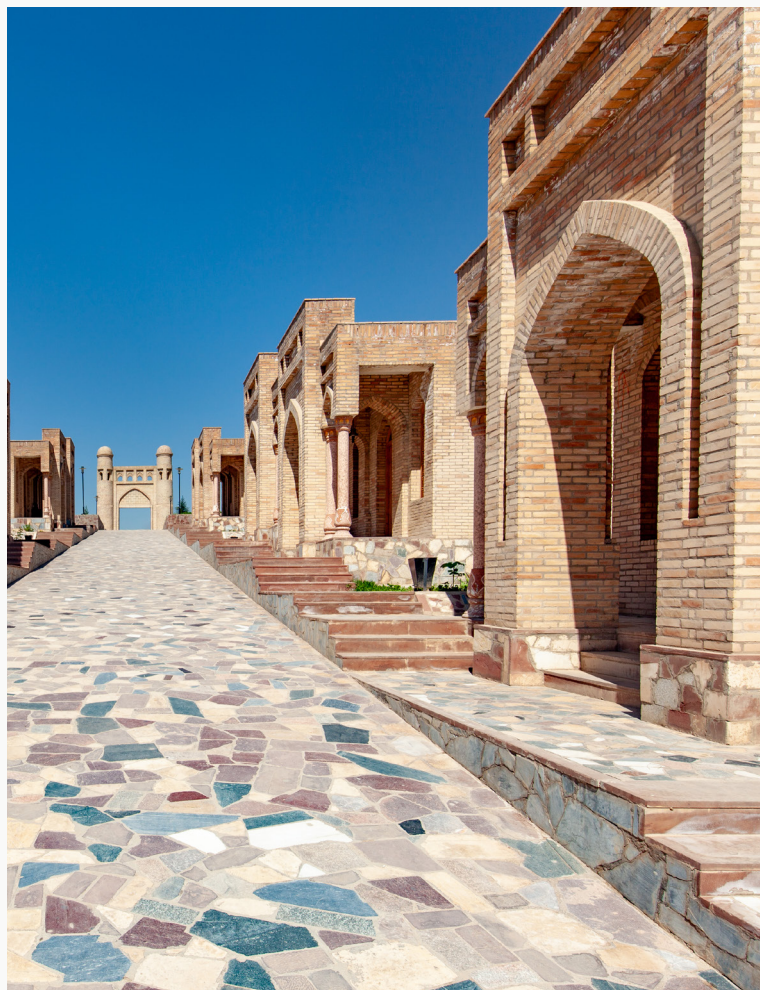
/ Деҳаи хурди Ҳисор

T4 – Қароргоҳи ИА, НИА, шарикони иҷрокунанда ва Ҳукумати Ҷумҳурии Тоҷикистон бояд барои вусъат додан ва татбиқи лоиҳаҳои таҷрибавӣ дар саросари кишвар равишҳои қавӣ таҳия кунанд ва ҳамин тавр, устувории дастгирии лоиҳаҳоро таъмин намоянд.