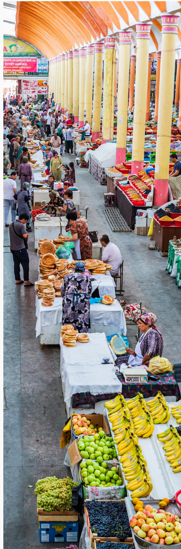
/ Бозори Панҷшамбе дар Ҳучанд